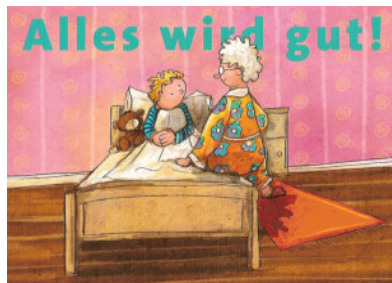
Buch: Antons Albraum, B. Furmann/M. Weber

Wenn Sie diese Fragen mit „JA“ beantworten, dann ist das Kind wahrscheinlich hochsensibel und äußerst feinfühlig in der Wahrnehmung äußerer Eindrücke und gefühlsmäßiger Verarbeitung.